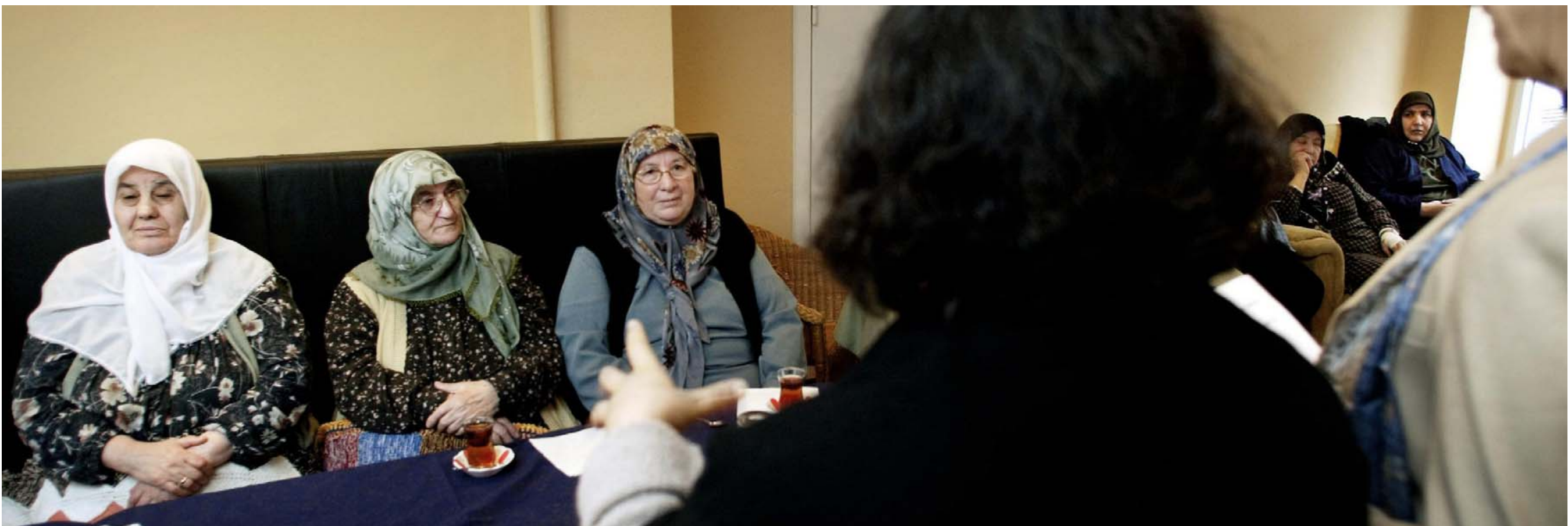
UDSAT. Dagens analyse bygger på en omfattende gennemgang af integrationsindsatsen 2000-2010. Den viser, at der er stor forskel på, hvordan indvandrere fra ikke-vestlige lande får hjælp i kommunerne. De ældre er de mest udsatte.