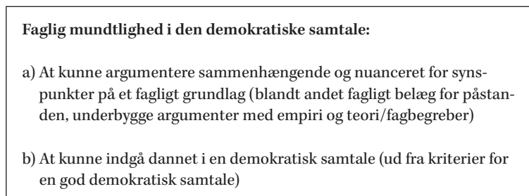
Figur 1: Faglig mundtlighed i den demokratiske samtale.

en faglig dialog” (uvm.dk). Dannelsesdimensionen bygger på kriterier for en god demokratisk samtale, som eleverne anbefales selv at være med til at udforme (jævnfør Haugsted 2013). I denne artikel forstås faglig mundtlighed i den demokratiske samtale derfor således: