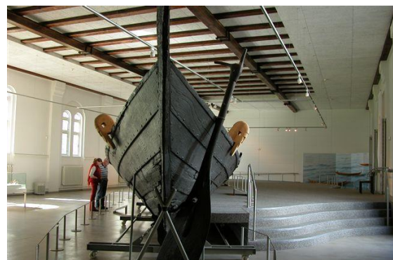
Fig. 6. Nydambåden set bagfra med sideror /styreåre og med pullerter (Gottorp Slot, Slesvig)