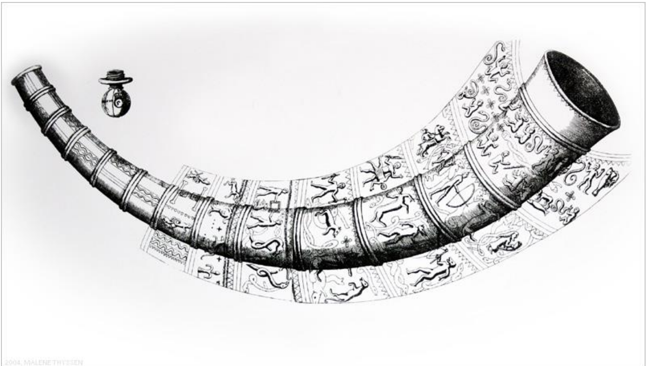
Fig. 1. Det lange guldhorn (Ole Worms tegning)

det lange guldhorn ” De aureo cornu ” med en tegning af hornet og en opmåling. Det lange horn vejede ca. 3,1 kg uden den prop, der blev tilføjet i 1639, så hornet kunne anvendes som drikkehorn af Christian den 4’s søn prins Christian. Diameter på den tykke del af hornet var 10,4 cm og selve den ydre kurves diameter, der omsluttede hornet var 75,8 cm.