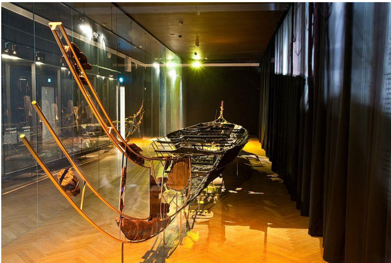
Fig. 2. Udstillingen på Nationalmuseet fra 1987