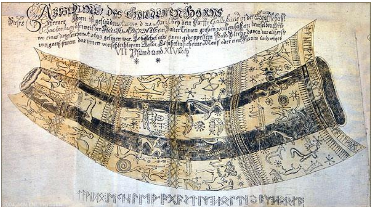
Fig. 2. Det korte guldhorn med runeindskrift øverst

Det er kun de to sæt ufuldstændige tegninger, der var til rådighed, da hornene i 1802 blev stjålet fra kunstkammeret og hurtigt blev omstøbt og solgt som smykker mv. Derved mistede man sikkerheden for, at de figurer og den form hornene havde, kunne genskabes korrekt. Ikke destomindre blev der lavet rekonstruktioner at de to guldhorn, der fremover blev udstillet på Nationalmuseet. Guldhornstyveriet fik stor litterær- og kulturhistorisk betydning, da Oehenschläger med guldhornenes forsvinden straks skrev digtet "Guldhornene". Det er nok herfra at guldhornenes egentlige popularitet blev skabt. Historien med tyverier var dog ikke slut. De rekonstruerede guldhorn blev under en særudstilling i Jelling 2007 atter stjålet. Denne gang kom de dog tilbage i ubeskadiget tilstand. Tidligere i 1993 har et par kopier af snoede horn på Moesgård Museum været stjålet, her blev hornene ret skadede inden de blev genfundet. Alle tyverier er opklaret og