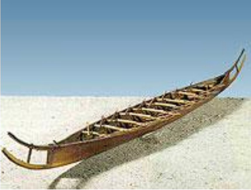
Fig. 4. Rekonstruktion af Hjortspringbåden på land