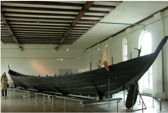
Fig.7. Nydambåden set fra siden