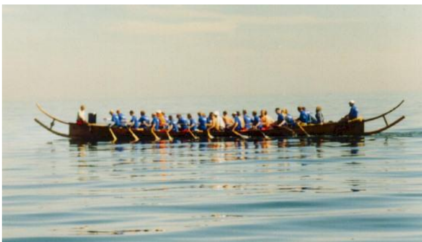
Fig. 3. Rekonstruktion af Hjortspringbåden (1999) under sejlads