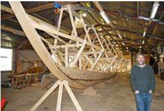
Fig. 8. Rekonstruktion på vej 2008 (Sundeved)