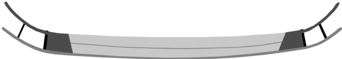
Fig. 1. Rekonstruktionstegning - længde 19 m, bundplanke ca 15,3 m, 4 bordplanker hver ca 15 m