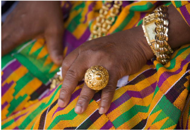
Guld er fortsat et tegn på værdighed for en høvding.

mens briterne overtog den vestlige halvdel og indlemmede det i Guldkysten.