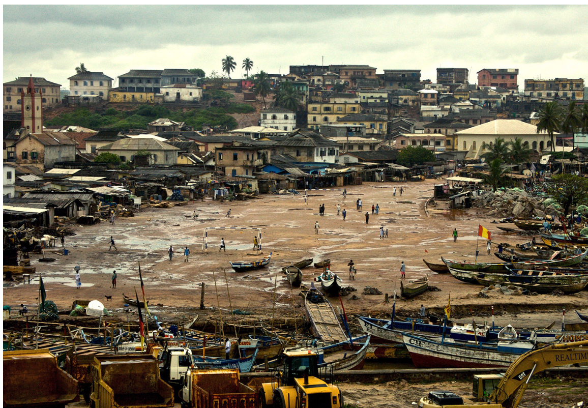
Fodboldbane i Ghana.

Afslutningen af kuptiden og stabiliseringen af økonomien har imidlertid betydet, at en del veluddannede ghanesere vendte hjem efter årtusindeskiftet, en del af disse med penge på lommen samt gode erfaringer og et internationalt netværk, som satte dem i stand til at starte forretninger.