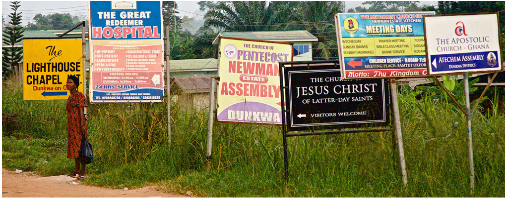
Kirker i Ghana.