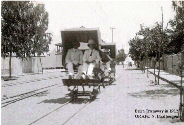
Beira Tramway in 1912

Sporvogn i Beira i 1912. Uden hest og motor! Man kan lige ane fødderne af den afrikanske mand, der skubber vognen.