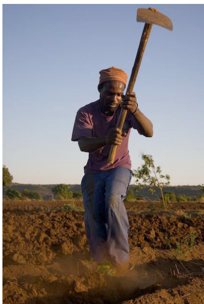
Det er et slid at forvandle solbagt jord til nyplanted.

„Det er dyrt, og prisen går kun op og op.“