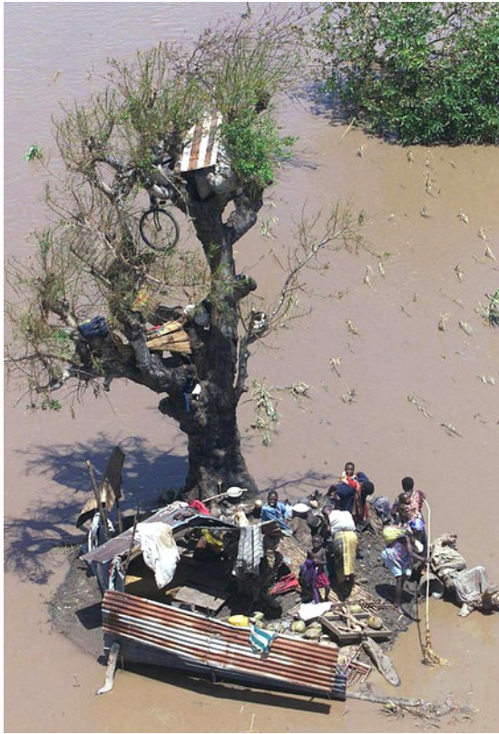
Floddale og kystområder i Mozambique bliver tit oversvømmet. Så må folk redde sig selv og deres værdier op i træer og de få, små steder, der når over vandet.

Også i dag er magthavernes opmærksomhed mere rettet væk fra indlandets fattige bønder ud mod havets gasfelter og oversøiske investorer.