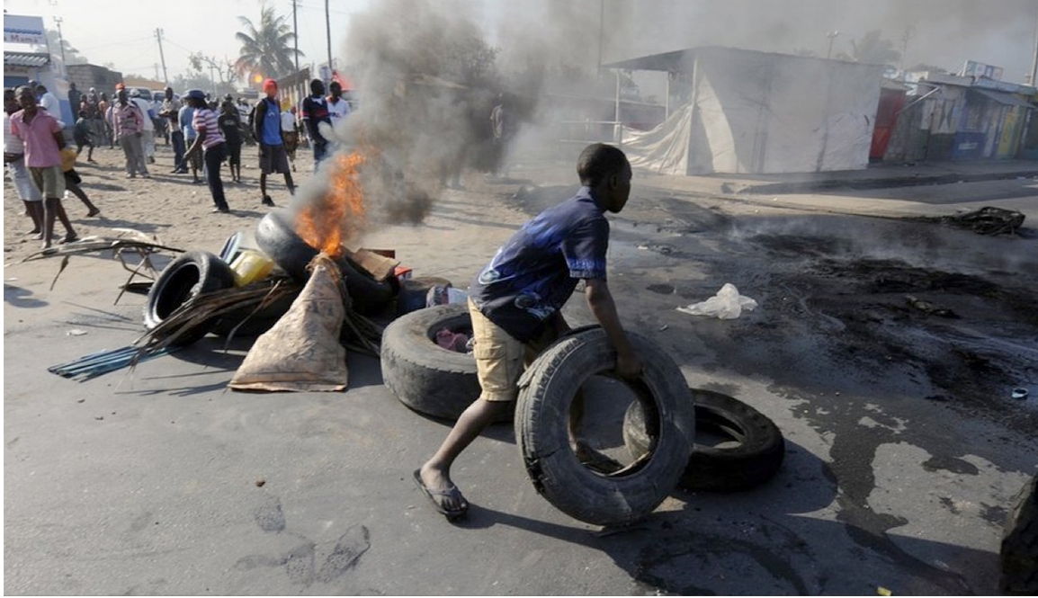
Optøjer i hovedstaden Maputo, 2010.

testerede mod stigende priser på mad og transport. De nøjedes ikke med fredelige demonstrationer, men væltede biler og stak dem i brand, plyndrede butikker og kastede sten mod politiet, som slog hårdt igen med riffelkugler og tæsk: Fire personer blev dræbt i 2008 og ti i 2010.